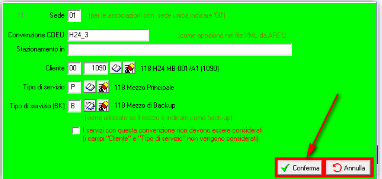
Figura 4 - completare le scheda e premere CONFERMA

Completare i dati con quanto annotato nel punto precedente e premere conferma.